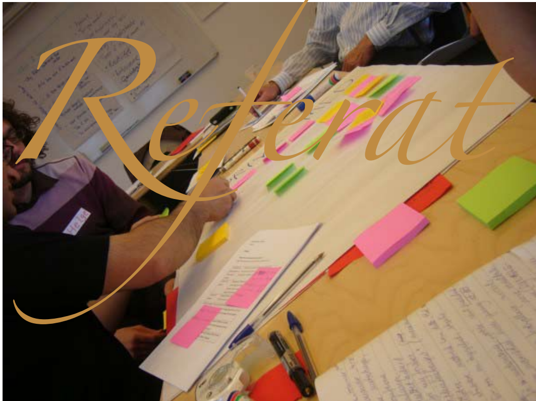
Nasjonalt møte i Oslo 12.05.07 Nettverk for deltakende aksjonsmetoder (NND)